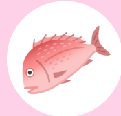
さくらだいら 桜鯛