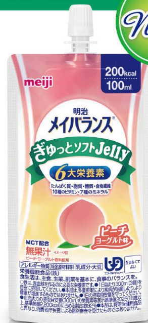
ピーチヨーグルト味