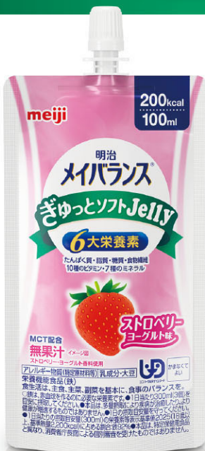
ストロベリーヨーグルト味