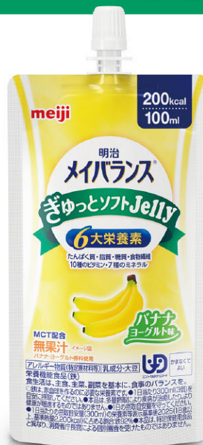
バナナヨーグルト味