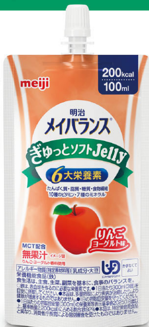
りんごヨーグルト味