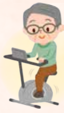
エアロバイクを漕いで運動する