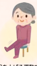
足を上げる運動で、太ももの前側の筋肉(大腿四頭筋)を使う